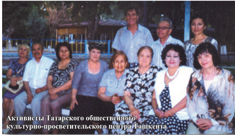
Активисты Татарского общественно-культурно-просветительского центра Ташкента

Постоянно проводятся конкурсы молодых исполнителей с целью выявления лучших исполнителей татарских народных песен, танцев, а также произведений современных татарских композиторов.