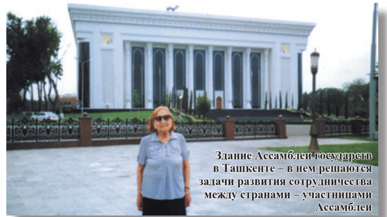
Здание Ассамблеи государств в Ташкенте – в нем решаются задачи развития сотрудничества между странами – участниками Ассамблеи

Мира и успехов в укреплении дружественных отношений между государствами Узбекистан и Россия!