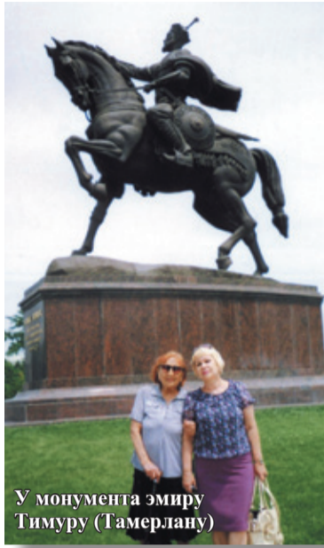
У монумента эмиру Тимуру (Тамерлану)

В реализации большинства инвестиций участие принимает Исламский банк развития.